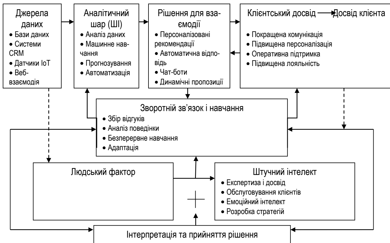
Рис.1. Концептуальна модель управління якістю туристичних послуг в умовах цифровізації «Синергія між людським фактором та штучним інтелектом»*