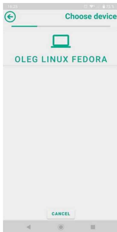
Рис. 4 – Вибір девайсу

Головна сторінка містить логотип, налаштування, кнопка для відправки даних, кнопка для отримання даних з буфера обміну від іншого девайсу. На даній сторінці автоматично запускається сервіс для прийняття та обробки запитів.