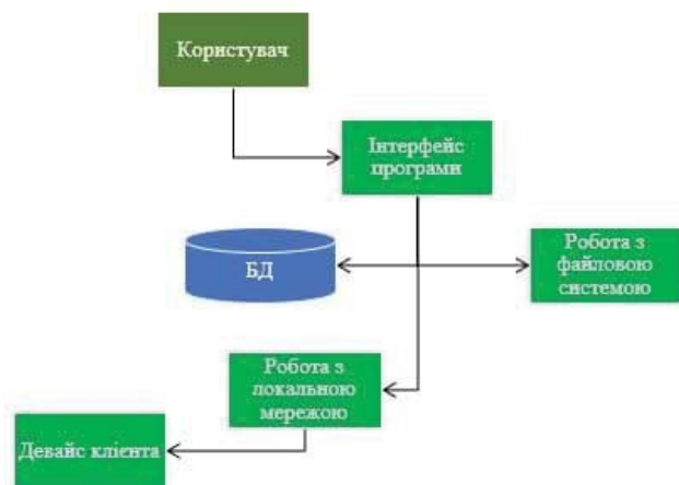
Рис. 1 – Інформаційна модель

Для реалізації мобільного додатку було використано мови програмування Java та Kotlin. Java використовувалась для обробки інтерфейсу, Kotlin використовувалась для написання сервісу відправки, прийняття та обробки даних. Для реалізації графічного інтерфейсу була використана технологія XML. В якості бази даних задіяна вбудована в операційну систему Android система управління базами даних SQLite та бібліотека SQLiteOpenHelper для підключення і роботи з БД.